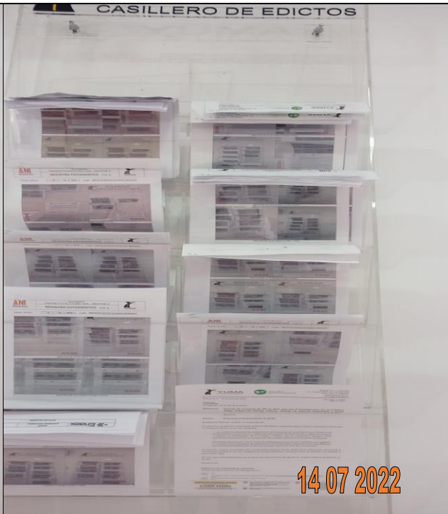
EDICTO R_34750 YC-CRT-116561