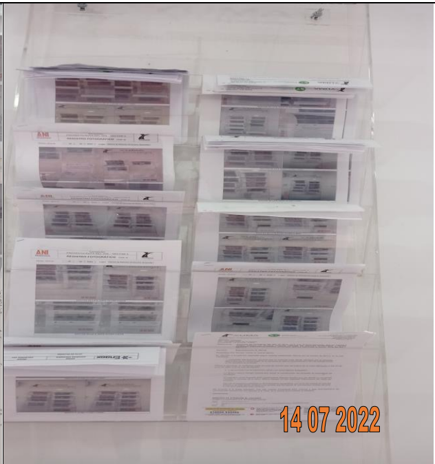
EDICTO R_34750 YC-CRT-116561